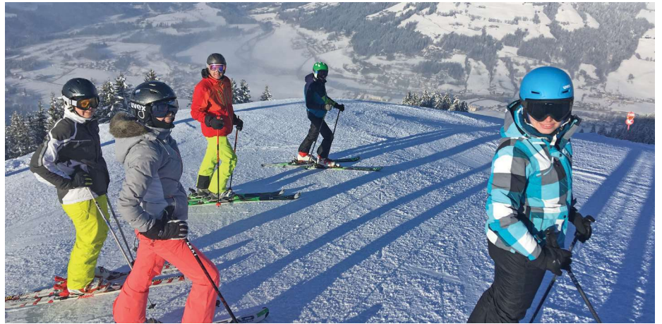
Morgens die Ersten auf frisch präparierten Pisten ins Tal nach Westendorf