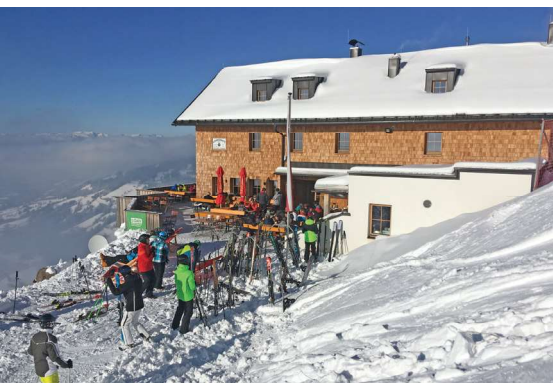
Unsere Alpenrosenhütte: mitten im Skigebiet auch tagsüber ein beliebter Treffpunkt und Jausenstation für Skifahrer

Drei Skiausfahrten führen uns in dieser Saison nach Westendorf auf unsere Alpenrosenhütte. Die Lage der Hütte mitten im Skigebiet bietet beste Voraussetzungen für unbegrenztes Skivergnügen in der Skiewelt Wilder Kaiser - Brixental.