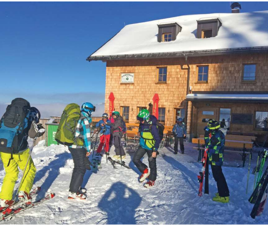
Ankunft an der Alpenrosenhütte