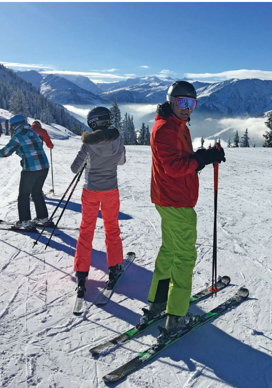
Skiewelt Wilder Kaiser-Brixental: weite Pisten inmitten verschneiter Berglandschaft